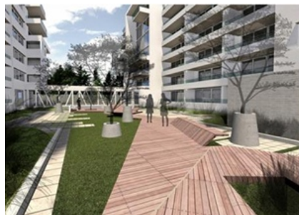
CONECTIVIDAD. El proyecto se encuentra cerca de la futura estación de Metro Chile España.

El segundo lugar lo obtuvo el edificio Vincent , con 3.151 cotizaciones en línea. Este proyecto se ubica en Holanda 3607, en la comuna de Ñuñoa, cerca de restaurantes, plazas, colegios y de la futura estación de Metro Chile España.